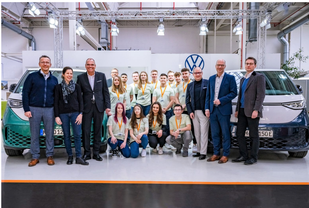
Das Projektteam vor dem neuen ID. Buzz 1 und dem neuen ID. Buzz Cargo 2