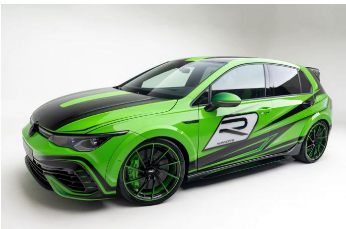
Abbildung 3 – HURRICANE im Fotostudio