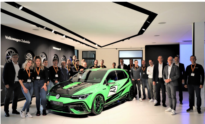
Abbildung 1 – HURRICANE mit Projektteam, Volkswagen Management und Betriebsrat bei der Volkswagen R in Warmenau